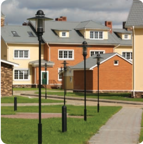
Клубная резиденция «Ангелово» (Московская обл.)