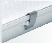
Защелка из нержавеющей стали (под заказ).