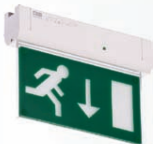
MIZAR SP LED