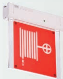
MIZAR SI LED