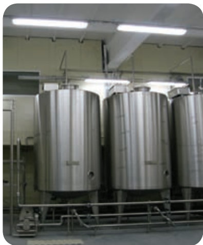
Производственный комплекс ЗАО «Макарово» (Киевская обл.)