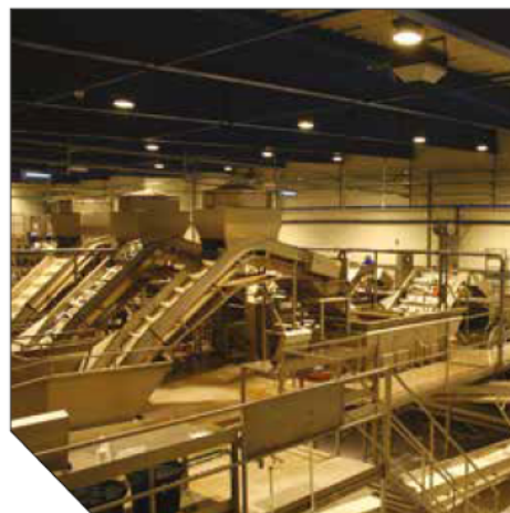
LODESTAR LED D120