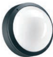
Цвет корпуса – черный.