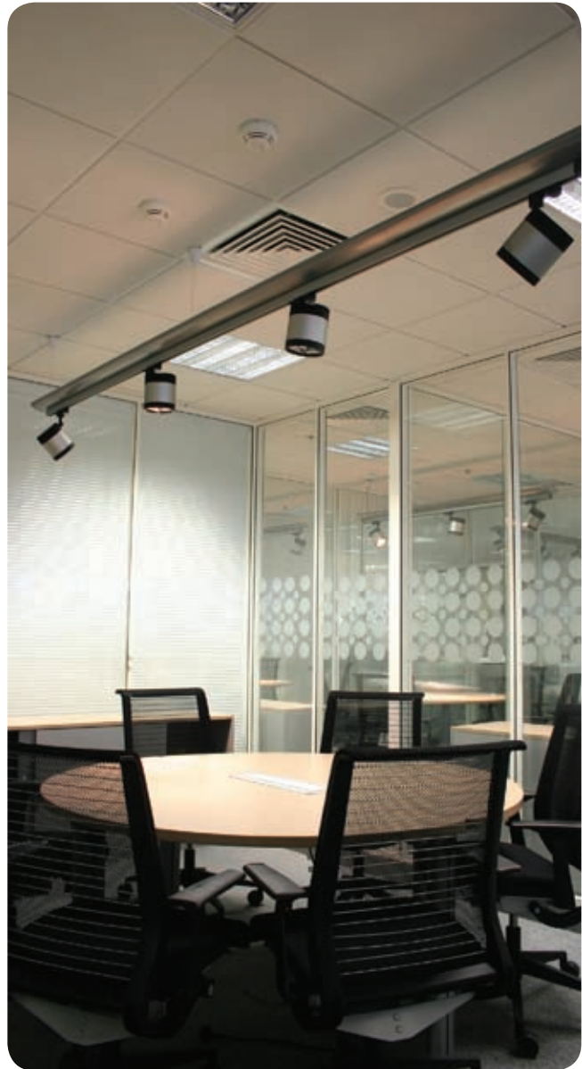
Офис компании British Petroleum (Москва)