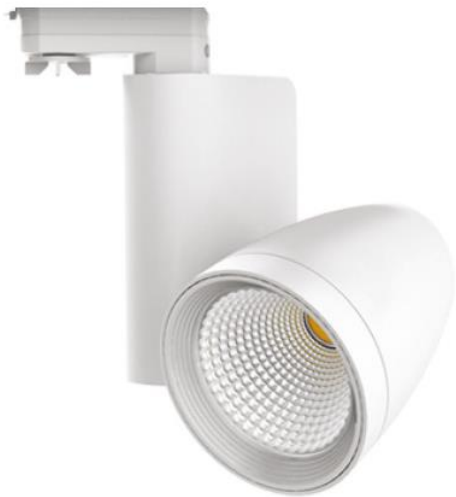
ДДО26-25-001 Accent 840