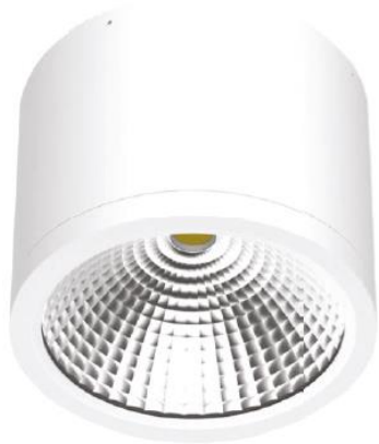
ДПО39-25-001 Cylinder 840