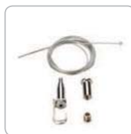
Комплект для подвеса (арт. 01839)