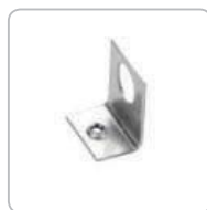
Угловой элемент подвеса (арт. 01822)